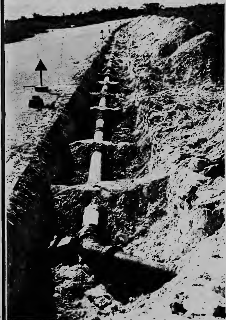
Recientemente Water- en Energie bedrijf (WEB) a cuminsa cu ponemento di tubonan di awa riba L.G. Smith Boulevard pa asina por haci e realizacion di e "Plan Malmok" bira posibel. E tubonan di heru basha lo bira tres kilometer largo y lo sirbi pa conecta e vecindario aki riba e red di distribucion di awa, en vista di e futuro plannan pa construi mas hotel na beach. E foto ta muestra un parti di e trabao cu ya a ser realiza. Na principio di 1966 nan ta spera cu e instalacion completo lo keda cla.